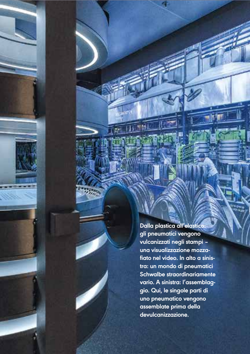
Dalla plastica all'elastico: gli pneumatici vengono vulcanizzati negli stampi - una visualizzazione mozzafiato nel video. In alto a sinistra: un mondo di pneumatici Schwalbe straordinariamente vario. A sinistra: l'assemblaggio. Qui, le singole parti di uno pneumatico vengono assemblate prima della devulcanizzazione.