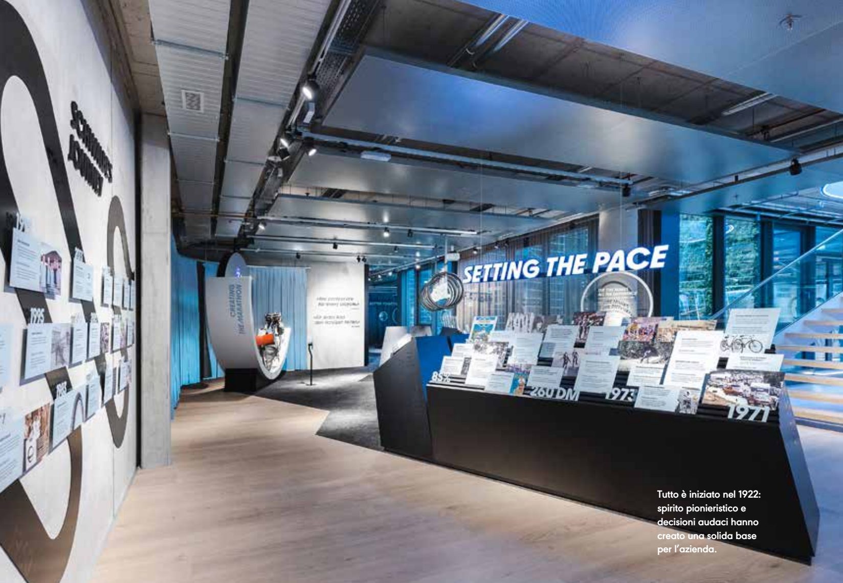
Tutto è iniziato nel 1922: spirito pionieristico e decisioni audaci hanno creato una solida base per l'azienda.